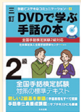
左/「これで合格! 2023 全国手話検定試験 (DVD付き)」 右/「DVDで学ぶ手話の本シリーズ」 5～2級 [三訂版]・準1級 1級 [改訂版]