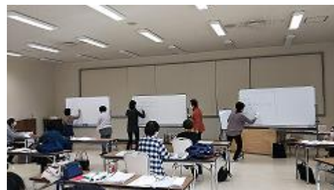
手書きコースの様子