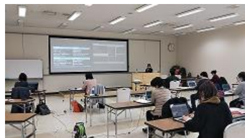
パソコンコースの様子