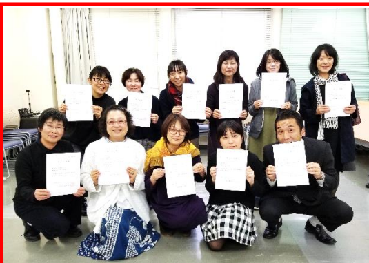
※講座最終日(都合により1名欠席)の記念写真