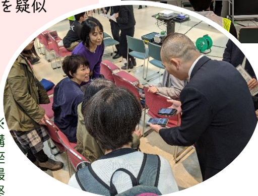
上…アイランズ公演の様子 左…Net110アプリ説明会では参加者も興味津々！