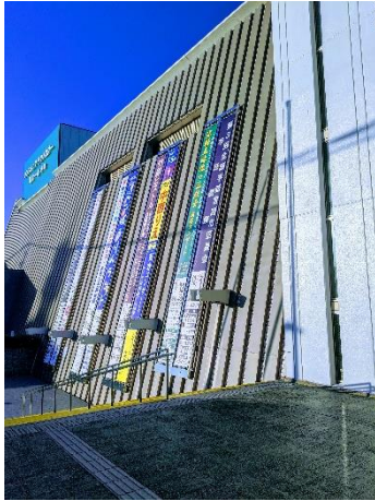
左…ミニ筆談ボード作成体験の様子

去る12月1日(日)に、シンフォニアテクノロジー響ホール伊勢(2F 展示室)で開催した「第8回センターまつり」は約280名を超える参加があり、大盛況のうちに終了いたしました！