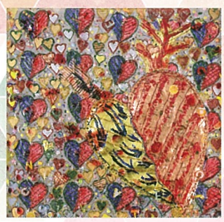
作画者 国広 富之 俳優

元気が 3つめの目までした はせだが 元気が なくなくて 3つめの目 懐いてくれます カチカチ カチカチ 足もとの前色 信頼の心 地おき音をたてて 希望へ 私を運んでくれます 命と共に大切な白い杖 おけむのびない 3つめの目です