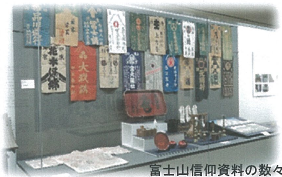
富士山信仰資料の数々