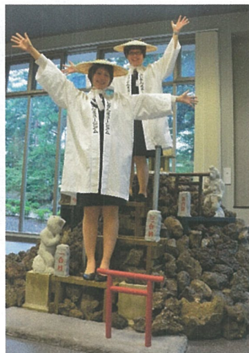
ロビーには 1/5 サイズの富士塚があり、 富士講の装束を着て記念撮影が大好評