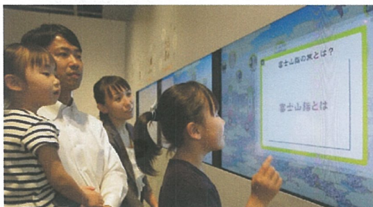
アクティブな操作が魅力のタッチパネルモニターで 富士登山の今と昔を知ろう