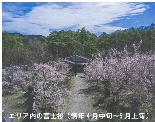
エリア内の富士桜（例年4月中旬～5月上旬）